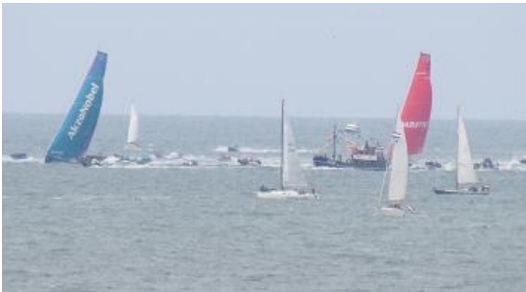
De Sch 236 bij de finish van de Volvo Ocean Race.