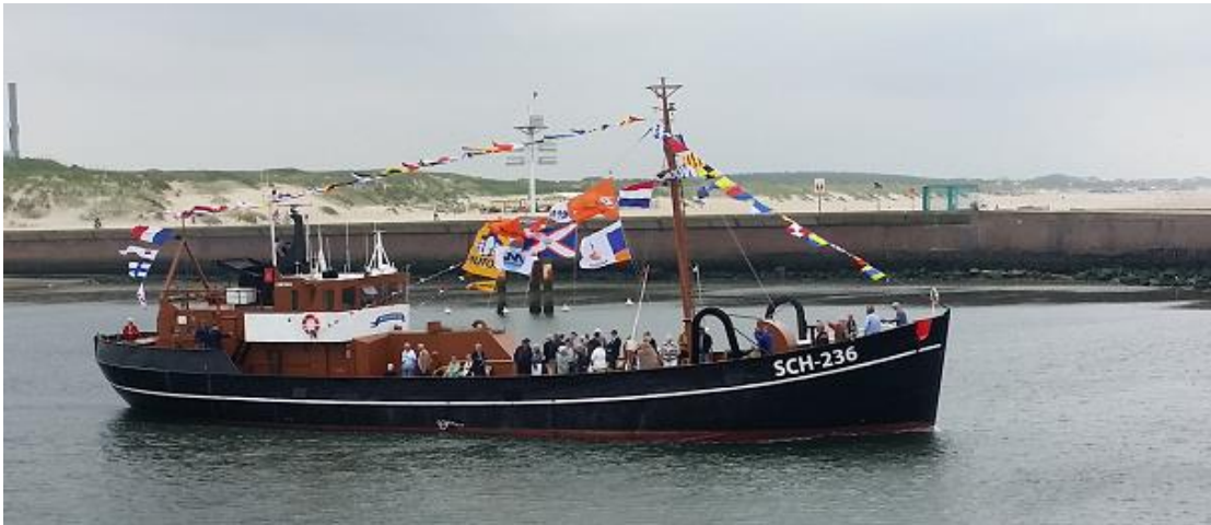
SCH 236 uitgaand op Vlaggetjesdag.