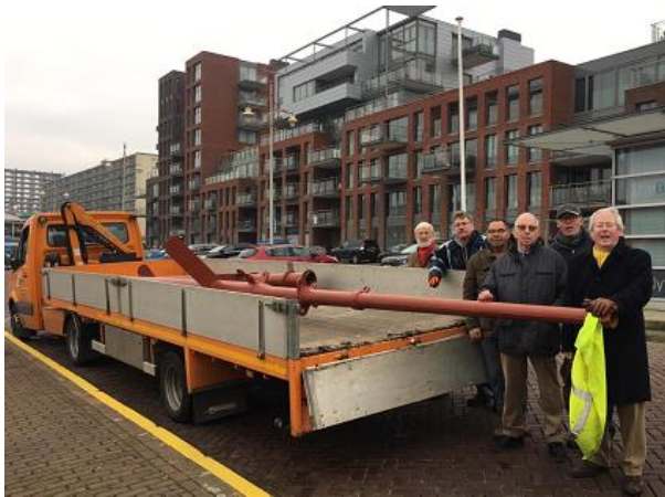
Bovendeel masten klaar voor vervoer