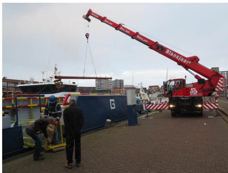
Een bijzondere lading.

Het jaar kreeg een mooie afsluiter. Op 21 december kwam vanuit Gdynia in Polen de nieuwe Aurora-G van Rederij Groen binnen met een bijzondere lading aan boord: twee masten voor de Noordster. Wie had ooit kunnen vermoeden dat een nieuwe Aurora-G masten zou komen brengen voor de oude Aurora-G, zoals de Noordster voorheen heette. Zij werden op 28 december van boord gehaald. Het zal niet lang meer duren voordat de masten de Noordster een ander gezicht zullen geven.