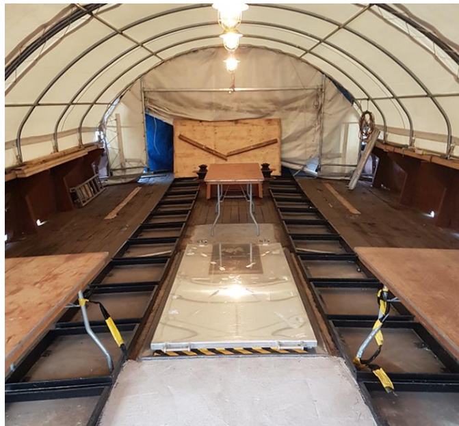
Het nieuwe luik naar de publieksruimte.

hele dek van de Noordster van zijn niet- oorspronkelijke opbouwen en obstakels ontdaan. De contouren van het oorspronkelijke vleetlogger dek komen nu goed in beeld. De luikhoofden liggen klaar en de houten luiken zijn bij ROC Mondriaan in de maak.