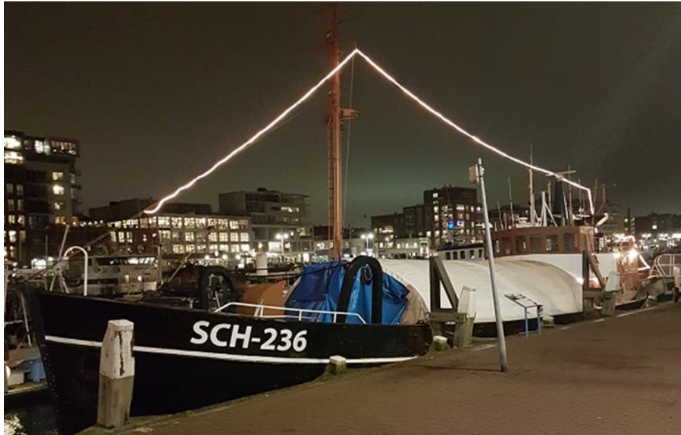
De Noordster klaar voor de Light Walk.