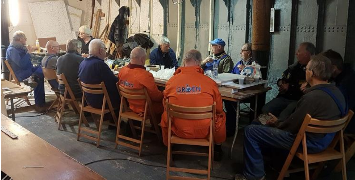
Schafttijd voor de Graaiploeg