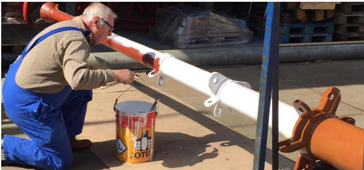
Het schilderen van de mast

Beide masten zijn in de bekende roodbruine 'loggerkleur' geschilderd. Het bovenste gedeelte van de mast, oftewel de 'steng', waaraan ook de toplichten zullen worden bevestigd, wordt spierwit. De knop op het topje van de mast, beter bekend als de 'kloot' wordt blinkend goud geschilderd. De plaatsing van de masten is een mooi symbolisch gebeuren in de geschiedenis van de Noordster. Want het is deze maand precies zeventig jaar geleden dat de Sleephelling Maatschappij Scheveningen in mei 1949 begon met de bouw van de Noordster (bouwnummer 34) in opdracht van rederij J.J. van der Toorn Azn.