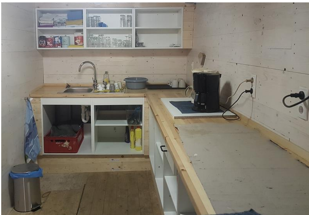
De nieuwe kombuis

Ook benedendeks is weer een forse slag gemaakt. De kombuis in de linker achterhoek van de toekomstige expositie- en publieksruimte kwam gereed. Van daaruit kunnen nu dranken en hapjes worden uitgegeven. Verder wordt nog gewerkt aan de betimmering van de wand aan stuurboordzij. Als die ook is voltooid, zal het benedendeks een mooie ruimte zijn. Het stadium zal zich weldra aandienen waarin we gaan bezien hoe de ruimte het beste als museale ruimte kan worden verlicht en ingericht.