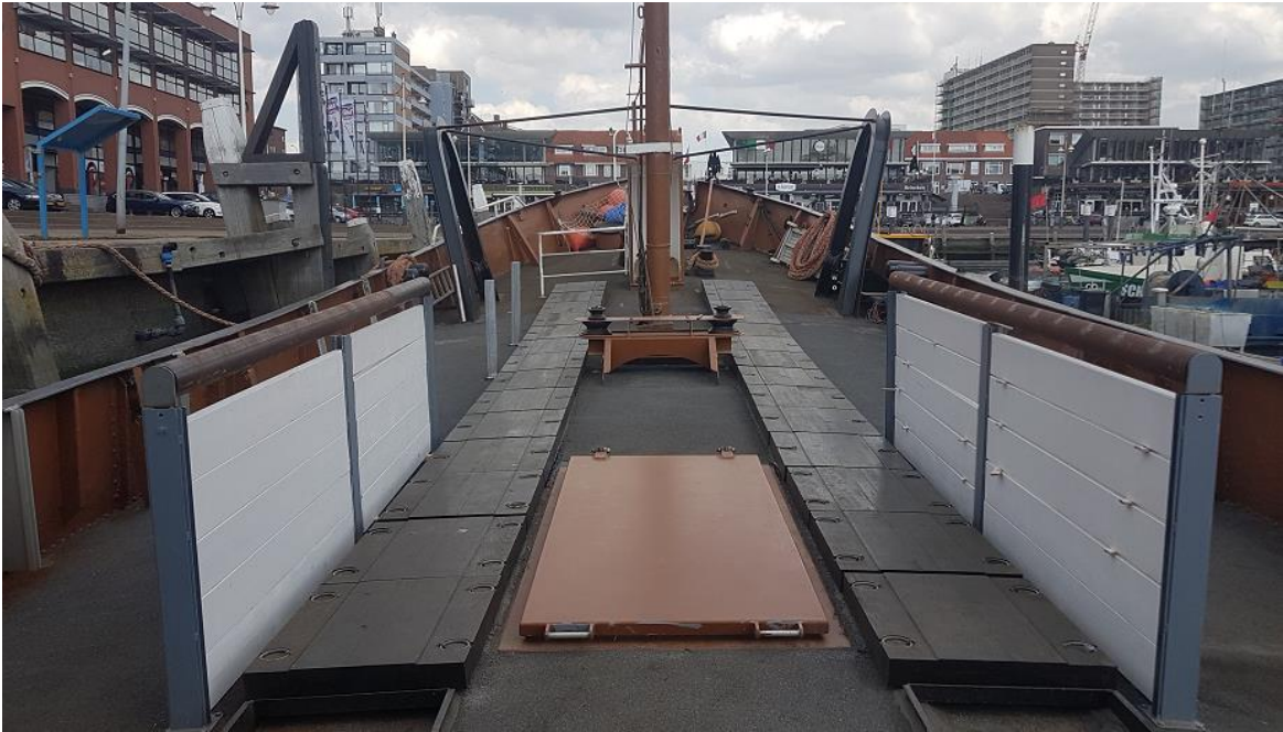
Het vleetloggerdek weer terug.

Ook benedendeks is weer een forse slag gemaakt. De kombuis in de linker achterhoek van de toekomstige expositie- en publieksruimte kwam gereed. Van daaruit kunnen nu dranken en hapjes worden uitgegeven. Verder wordt nog gewerkt aan de betimmering van de wand aan stuurboordzij. Als die ook is voltooid, zal het benedendeks een mooie ruimte zijn. Het stadium zal zich weldra aandienen waarin we gaan bezien hoe de ruimte het beste als museale ruimte kan worden verlicht en ingericht.