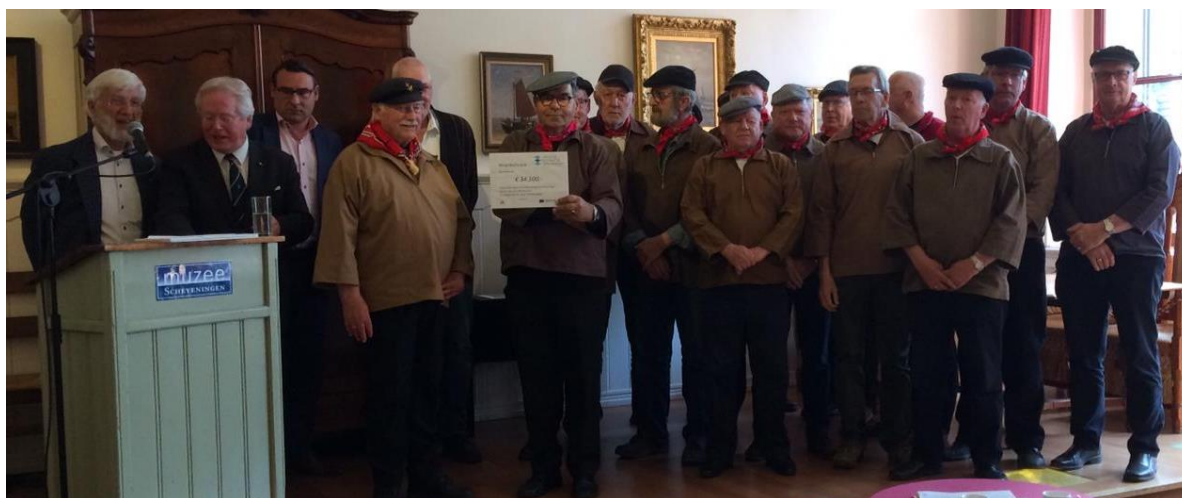
Ontvangst SIOS-cheque in Muzee Scheveningen]