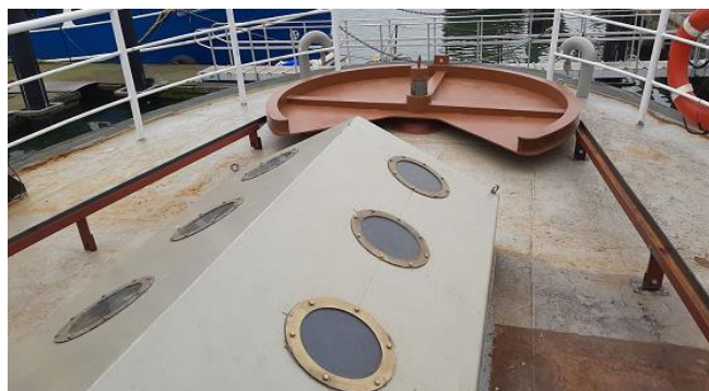
Afbeelding: kwadrant en koekoek op achterdek

Op het achterdek werd de koekoek voltooid en het kwadrant van de stuurinrichting geplaatst.