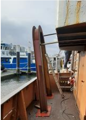
Afbeelding: trawlgalg stuurboord achter

Bovendecks werden aan stuur- en bakboord de achtergalgen geplaatst, zoals die samen met de voorgalgen voor de trawlvisserij werden gebruikt.