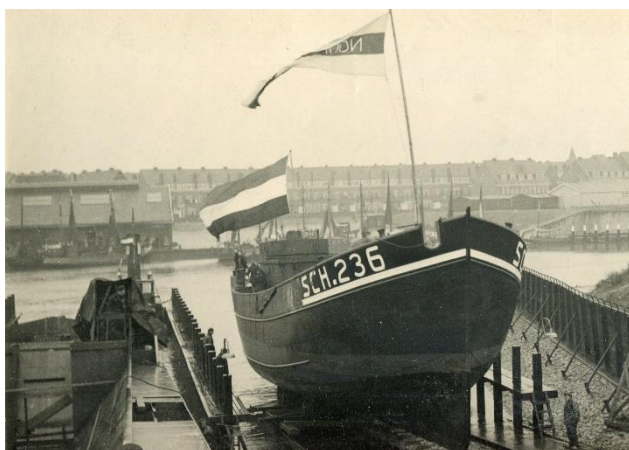
Afbeelding: Stapelloop Noordster

Daarbij mogen we terugzien op een voorspoedig verlopen 2019, waarin aan boord veel werk werd verzet. De Noordster kreeg haar masten terug met de originele tuigage, het achterdek zijn oorspronkelijke hekwerk en koekoek. De koelkast met kombuis werd ingekort tot de oorspronkelijke lengte. Het voormalige tonnenruim onderging een volledige gedaanteverandering. Het dek werd weer een echt vleetloggerdek met platte luiken en krebbes. De gangway werd naar midscheeps verlegd - en dat is nog maar een greep. Tijdens Vlaggetjesdag en Sail op Scheveningen hielden we open huis: ruim 4.000 bezoekers maakten kennis met het werk van de Noordster. Op 27 juni hadden we een geslaagde open dag voor alle donateurs en we kregen maar liefst twee keer maximale subsidie van de Stichting Initiatief op Scheveningen (SIOS). U kunt het allemaal en nog veel meer lezen in ons Jaarverslag 2019 dat binnenkort verschijnt.