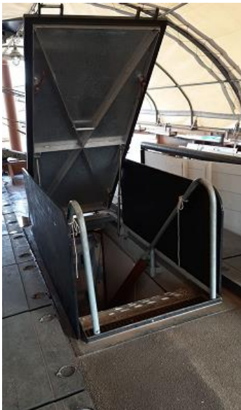
Afbeelding: entree trap naar publieksruimte

De entree van de trap die van het dek naar de publieksruimte leidt werd aan weerszijden van een beschermende afscheiding voorzien.