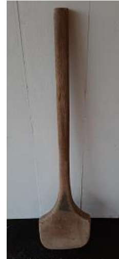
Afbeelding: houten warreleutel

Karel Pronk schonk een warreleutel – een grote platte houten spaan waarmee de haring in een langwerpige houten bak, de zgn. warrebak, door de stuurman met zout werd vermengd. Het was daarbij zaak om op de juiste hoeveelheid zout te letten.