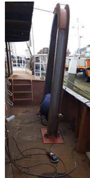
Afbeelding: trawlgalg bakboord achter

In de galg komt nog een blok te hangen, waar de lijn overheen loopt die de winch met het trawl-net verbindt.