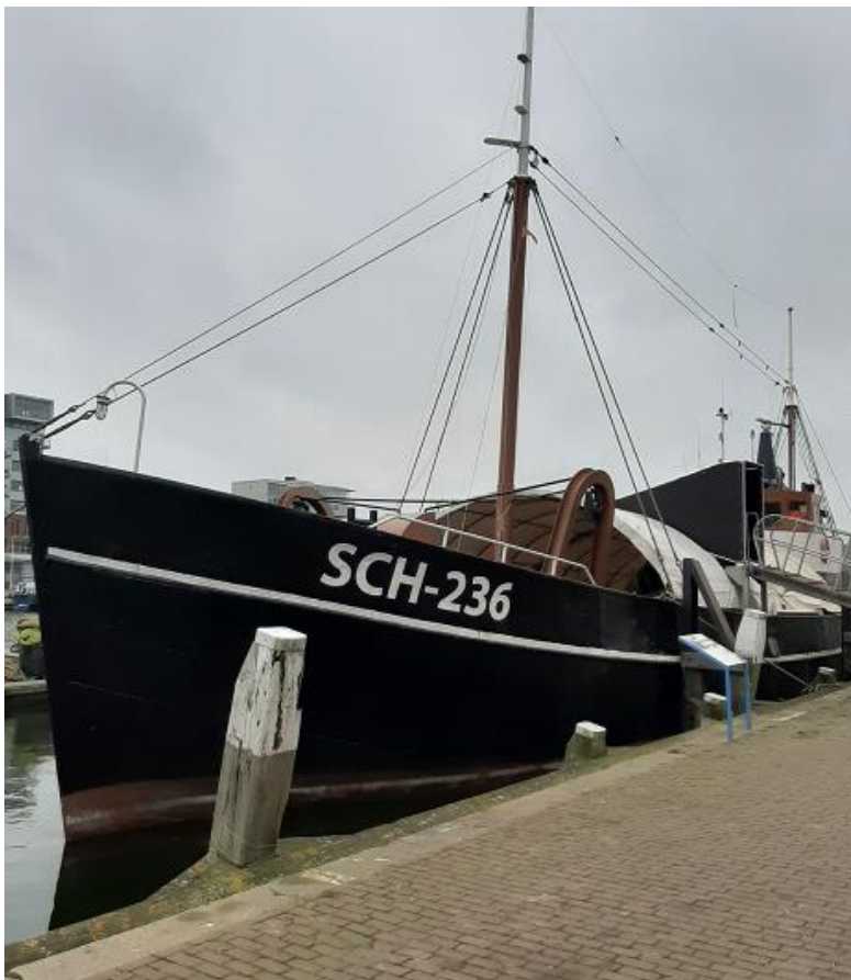
Afbeelding: Noordster met nieuw want voor de kant

Eens in de zoveel jaar moet de Noordster een hellingbeurt ondergaan om de scheepshuid na te lopen. Dit jaar is het zover. Het helling en het te plegen onderhoud is een kostbare zaak. We zijn daarom bijzonder verheugd dat vier bedrijven hebben aangeboden dit voor hun rekening te nemen. Van Laar Visserij Ketting in IJmuiden neemt de hellingbeurt in IJmuiden voor zijn rekening en doet al het ijzer- en plaatwerk. Verfleverancier Jotun in Spijkenisse levert daarbij gratis de verf voor onder en boven de waterlijn, Maaskant Shipyards in Stellendam loopt de motoren na en Hubel Marine uit Rotterdam maakt de Noordster vaarklaar voordat wordt omgevaren naar IJmuiden. De hellingbeurt vindt naar voorlopige planning plaats in augustus. We zijn de vier sponsors bijzonder dankbaar voor hun steun – het gaat alles bij elkaar om een substantieel hoge kostenpost die nu niet ten laste van de restauratierekening van de Noordster komt.