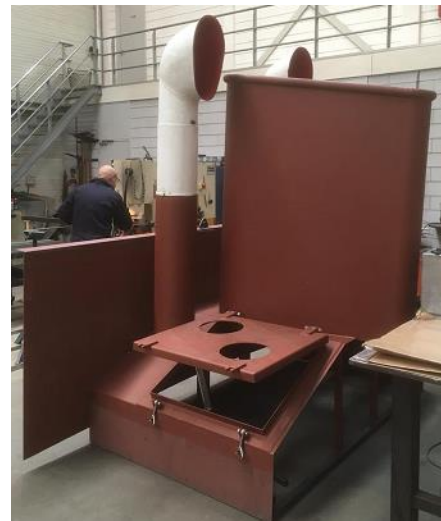
Schoorsteen met luchthappers

U ziet: ook al liggen de werkzaamheden aan boord noodgedwongen stil, daar waar mogelijk vinden de werkzaamheden aan de wal voortgang.