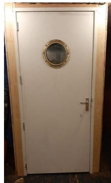
Toegangsdeur met patrijspoort