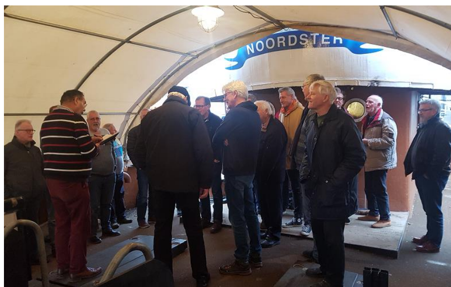
Roll Call (oefening brandalarm)