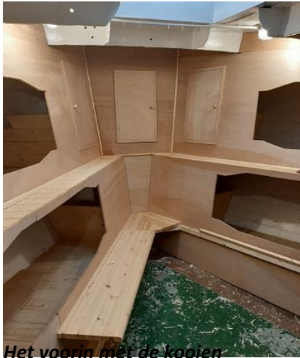
Het voorin met de kooien

De kooien in het voorin werden nagenoeg voltooid. Men kan er al in gaan liggen... Door de ruimte die de kooien innemen valt nu al goed te zien hoe klein dit bemanningsverblijf eigenlijk was. Aan de wand werden deurpaneeltjes aangebracht op de plaatsen waar zich de kastjes bevonden voor het opbergen van proviand en andere spullen. Onze leermeesters hebben hiermee samen met de ROC-jongeren goed werk verricht.