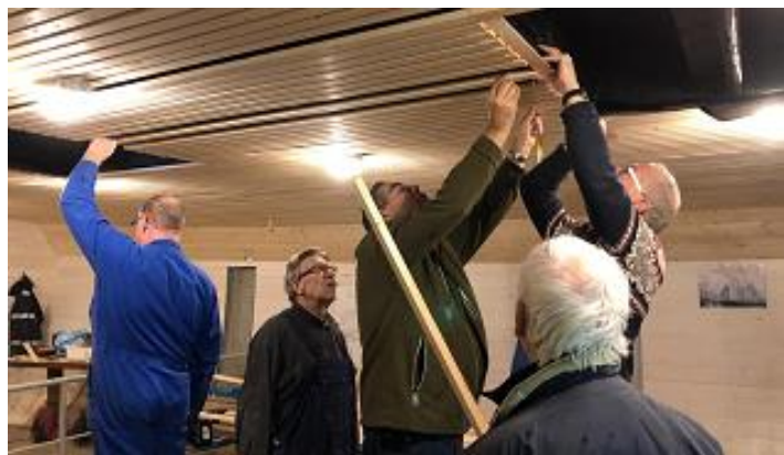
Werken aan plafond

In de publieksruimte werd de laatste hand gelegd aan het plafond of beter het 'dek', zoals deze onderkant van het bovendek door de visserlui aan boord werd genoemd. De door de graaiploeg met latten in de lengterichting bezette zoldering biedt een mooie strakke aanblik. Lat voor lat is met jobsgeduld in de lak gezet. De entree werd voorzien van een toegangsdeur met daarin een patrijspoort ter verhoging van het maritieme karakter.