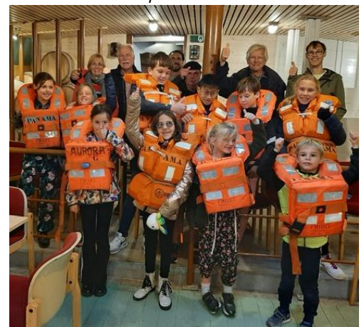
Kinderen op de Noordster

Zaterdag 2 oktober hadden we een enthousiaste groep jeugdige bezoekers te gast. Het bezoek was een initiatief van bewoners van de Koppelstokstraat en De Reder Het Vervolg, die in coronatijd door de kinderen blij verrast werden met een soort van 'show' die de kinderen gaven op de binnenplaats van het wooncomplex. Nu konden de kinderen een kijkje nemen aan boord van de Noordster in plaats van er alleen maar langs te lopen. De kleine prentertjes kregen verteld over de visserij en hoe het leven vroeger was aan boord. Ook kregen zij onderricht over het dragen van een zwemvest en legden zij hun eerste zeemansknoop.