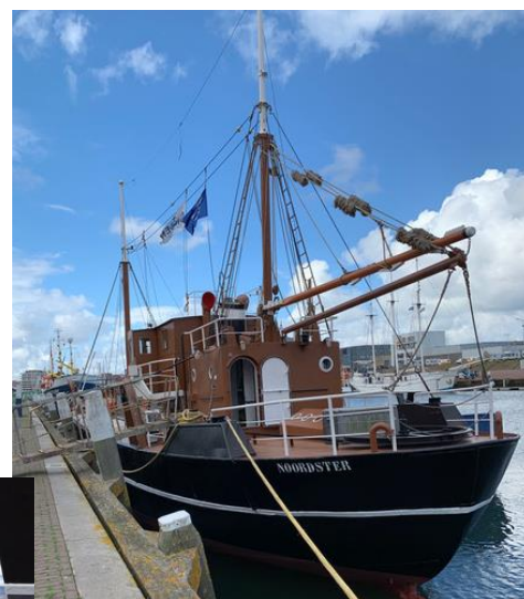
De naam op de bakboordsbil