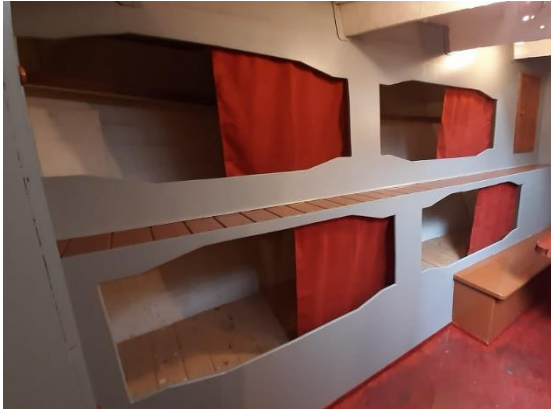
Kooien voorin met gordijntjes

in het voorin allemaal voorzien van gordijntjes, die met zorg op maat werden gemaakt door vrijwilligster Tineke Bruin. Van Het Schevenings Toneel kregen we behalve een zwarte plunjezak, twee gele oliejasen en nog andere voorwerpen, ook een paar dekens om in de kooien te leggen. Het zijn de echte, zoals ze vroeger aan boord werden gebruikt: donkergroen van kleur met één of meer zwarte banden over de volle breedte. Zo'n deken werd ook wel een 'kombaers' genoemd. In de komende weken worden ook de strozakken gemaakt die, na zo vol mogelijk te zijn gevuld met stro, in de kooi tot matras dienen.