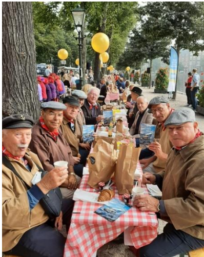
Graaiploeg aan Noordstertafel

een tafel die al gauw bekend stond als de 'Noordstertafel'. Burgemeester Jan van Zanen, die met een platte schuit (een zgn. Kagenaar) over de Hofvijver was gearriveerd en iedereen al varend verwelkomde en toesprak, maakte een rondgang langs de tafels en praaide dus ook de Graaiploeg. Daarop volgde onvermijdelijk een groepsfoto met de burgemeester, die overigens vaardig omging met de zgn. 'dissel' waarmee vroeger aan boord de kantjes werden geopend en dichtgeslagen en die nu als attribuut op de Noordstertafel stond.