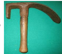
Close up van dissel