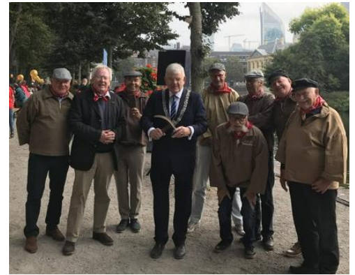
Groepsfoto met burgemeester