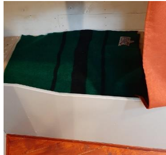
Kombaers in kooi