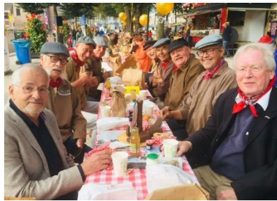
Idem van andere kant gezien