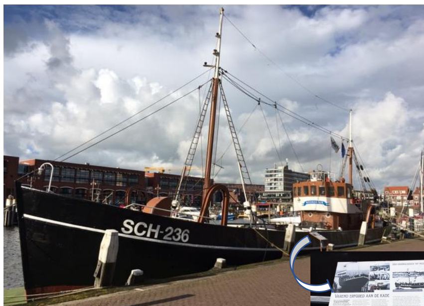
Noordster aan Dr. Lelykade

Het scheepje ligt er weer als een goudhaan bij aan de Dr. Lelykade schuin tegenover Het Gouden Kalf. Dit stuk kade is eigenlijk gereserveerd voor schepen van Rederij Groen, maar wij mogen er ook liggen en daarvoor zijn we Groen zeer erkentelijk. Op deze plek is er altijd veel loop, zodat de historische haringlogger veel bekijks heeft. Passanten kunnen het nodige over de Noordster lezen op het informatiebord dat naar deze plek is verplaatst. De folders in het bakje vinden gretig aftrek. Als iedereen de meegenomen folder nu ook invult en inlevert hebben we een mooie aanwas van donateurs.