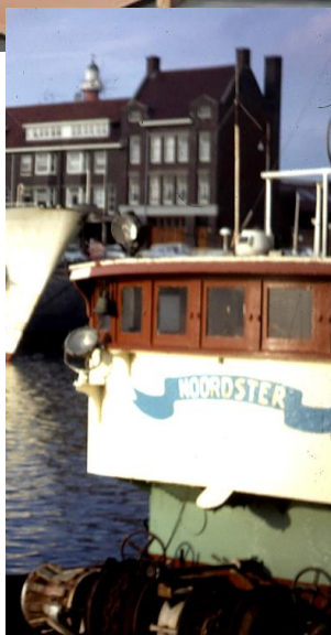
Frontsegment van de brug bij Boeg

De Noordster heeft daarmee dan weer helemaal haar oorspronkelijke aanzien terug gekregen. En daarmee haar gezicht dat beeldbepalend is voor een logger en waaraan men vroeger al op afstand een logger kon herkennen. Vanzelfsprekend brengen we op de brug ook alle oorspronkelijke kleuren terug, met op de voorkant de naam Noordster geschilderd in een blauwe wimpel op een achtergrond van de karakteristieke kleur zachtgeel.