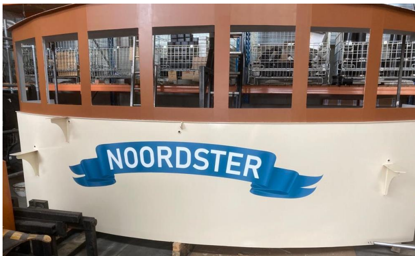
Front brug met wimpel

Als het klaar is gaat vanzelfsprekend ook de echte wimpel in top! We streven er naar dat het op Vlaggetjesdag klaar is.