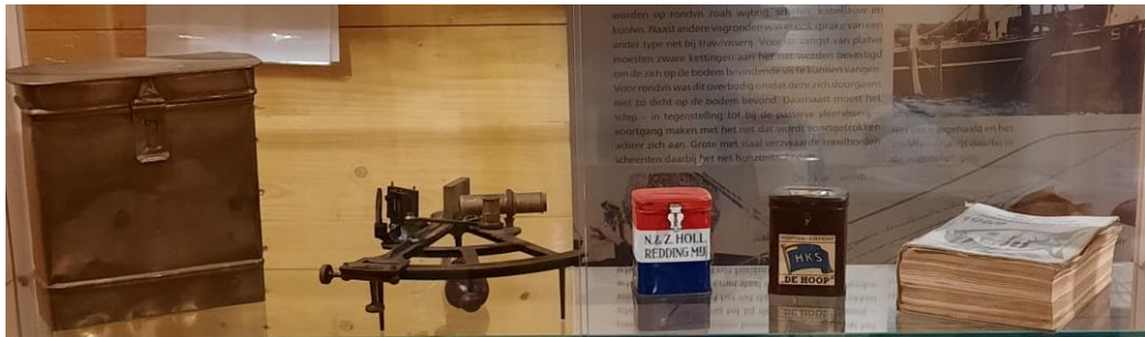
O.a. Collecteblikjes HKS De Hoop en NZHRM

Verder diverse spullen die aan boord werden gebruikt, zoals een kaakmand, afhaalmand en zoutmand - wie kent het onderscheid nog? - een slagputs, oliegoed en dekens. Ook een in visserskleding gestoken pop, die zoals vroeger bij de visserman gebruikelijk met kleding en al in een van de kooien in het vooronder ligt. Als museale aanwinsten zijn verder te noemen een stripmes ingebracht door Nico Mos, terwijl we van Bert van der Toorn ook een stripmes kregen, maar dan met afgeslepen lemmet opdat het als kaakmes kon worden gebruikt.