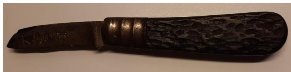
Van stripmes tot kaakmes

Piet Regeer vulde de collectie aan met een vuistdikke ‘Belgisch-Nederlandse Visserij Almanak uit 1952, zoals die destijds ook op de loggers werd gebruikt. Benedendeks is verder een begin gemaakt met de verwijdering van het interieur van het achterin oftewel de messroom, opdat ook die in de oorspronkelijk staat kunnen worden hersteld.