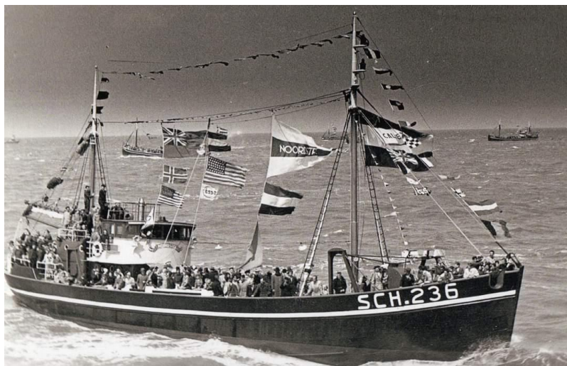
De Noordster buitengaats op Vlaggetjesdag 1950

Onze Noordster zal er dan vanzelfsprekend tot in de puntjes en feestelijk met vlaggen en wimpels versierd bij liggen, zoals het op het ‘Vlaggeschip van Scheveningen’ hoort.