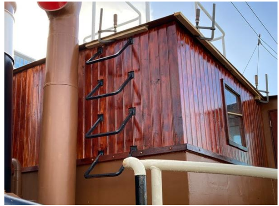
Afb. betimmering aan buitenkant van schippershut

De betimmering aan de buitenkant van de schippershut kwam gereed en staat strak in de lak. Zo is het houtwerk bestand tegen weer en wind waaraan het voortdurend en juist ook in de haven is blootgesteld. Daar is met veel zorg en toewijding aan gewerkt en het mooie is – en dat geldt voor veel onderdelen van de restauratie – dat het allemaal het resultaat is van de nijvere arbeid en inzet van onze enthousiaste vrijwilligers.