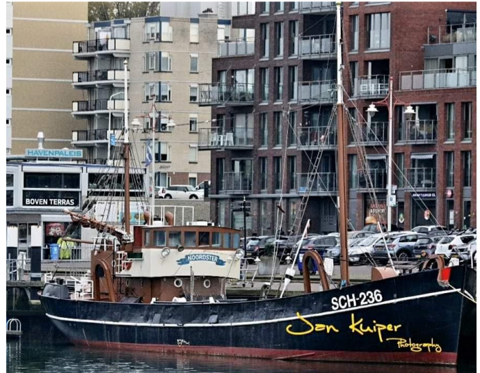
Afb. Sch 236, december 2022

Aan het eind van uw werkend leven Werd ge ons door Groen gegeven. In volle glorie terug naar tijd van toen Lof aan vrijwilligers die 't alles doen. Zonder hen én gevers met gulle hand Ligt er geen Noordster aan de kant!