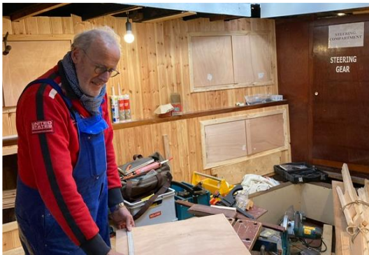
Afb. betimmering in messroom/achterin

Hetzelfde geldt voor de messroom oftewel het 'achterin'. Daar zijn beide wanden in nagenoeg originele staat teruggebracht en als de betimmering eenmaal op kleur is gebracht, oogt het weer als toen. De voormalige kooien zullen hier overigens voor een deel worden gebruikt als bergruimte, die aan boord hard nodig is. Als de banken en de tafel in het midden er eenmaal staan zal men ook hier desgewenst met een kleine groep kunnen vergaderen in historisch maritieme (vissers)sfeer.