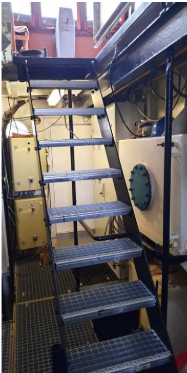
Trap naar brug en schippershut

Om de brug en schippershut gemakkelijker toegankelijk te maken werd er vanuit de omloop van de machinekamer een trap geplaatst die naar boven leidt. De trap komt uit in de schippershut en daar is het trapgat afsluitbaar met een gelijkvloers liggend scharnierend stalen luik.