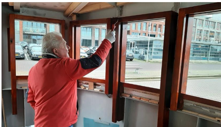
Schuifraam wordt in de lak gezet

Met het lengen der dagen komt beetje bij beetje de voltooiing van de restauratie steeds meer in zicht, in het bijzonder wat de brug en de schippershut betreft. In de afgelopen weken werd in de brug een begin gemaakt met de plaatsing van de schuiframen naar oorspronkelijke constructie. Dat gebeurt in vier van de negen ramen. Wanneer ze klaar zijn kunnen de ramen omlaag en omhoog getrokken worden met een leren riem, die voorzien is van een paar onder elkaar liggende gaten waarmee het raam op de gewenste stand kan worden vastgezet.