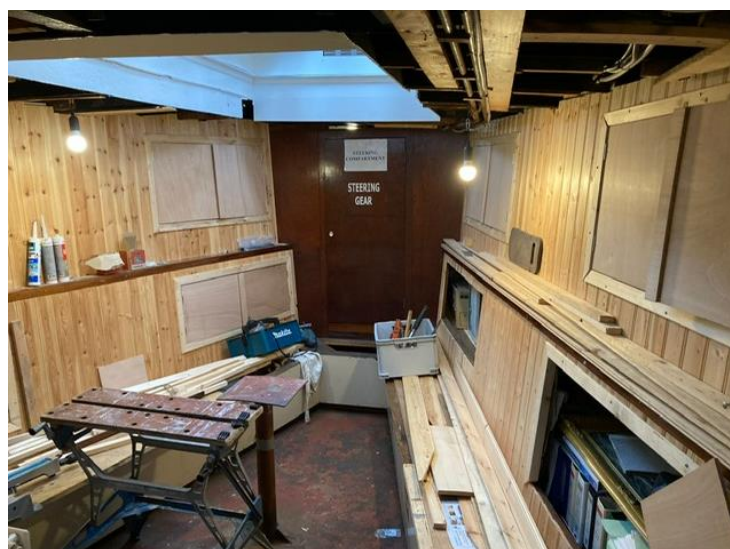
Kooien in messroom achterin

De inrichting van de messroom kreeg nader gestalte met de inbouw van de kooien, die als opbergruimten gaan worden gebruikt.