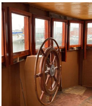
Stuurwiel in brug

Verder werd in de brug het stuurwiel geplaatst. Het is een origineel exemplaar uit de jaren vijftig zoals dat vroeger ook op een logger werd gebruikt. De brug krijgt ook hierdoor weer een stukje terug van de sfeer uit vroeger dagen.