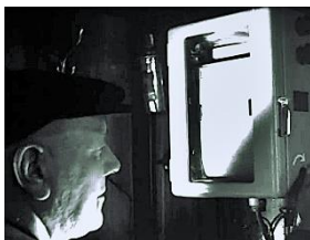
Schipper bij zeekaart

Ook elders aan boord zijn foto's aangebracht op plekken waar de bezoeker kan zien wat daar gebeurde. Zo in de schippershut naast de zeekaart een foto van de schipper die positie bepaalt. Achter de winchkop een foto van de afhouder met de reep. In het voorlogies een foto van de daar verblijvende bemanning, in de kombuis een plaatje van de kok, in de motorkamer de monteur met zijn 'karretje' en bij de krebber aan dek komt een foto waarop men kan zien hoe de vleet werd binnen gehaald. Bert van der Toorn stelde het allemaal samen en dat bovendien zonder de daaraan verbonden kosten van materiaal in rekening te brengen. Daarvoor dubbel dank!