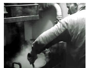
Plaatje van de kok

Die dank geldt ook voor de fraaie powerpoint presentatie die Bert van der Toorn maakte over het werk van het Hospitaalkerkschip De Hoop dat van 1899 tot 1988 onder de vissersvloot medische, materiële en geestelijke bijstand verleende.