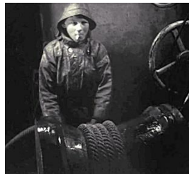
Afhouder achter winchkop